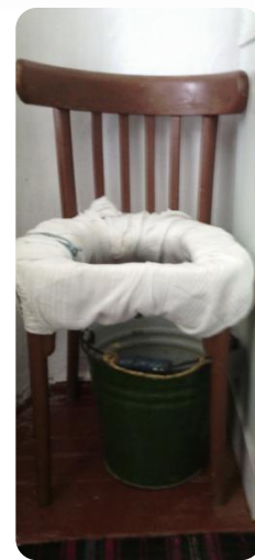
Een zelf- maak postoel voor een gehandi- capte vrouw..