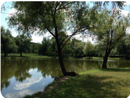
Stephen de la Mare, of te wel Stephen de Grote plein